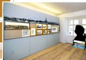
モーツァルトが生きた時代の ウィーン: マルチメディア・イン スタレーション「モーツァルト の住居」