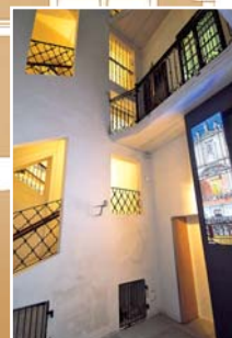
中庭 入り口: マルチメディア・インスタ レーション「ウィーンへやって きたモーツァルト」