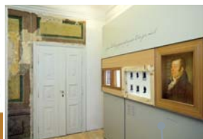
モーツァルトの音楽的世界: フィガロの部屋 歴史的な壁面装飾