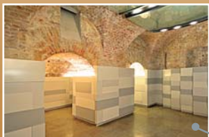
イベントホールは室内楽コンサート、 シンポジウム、プレゼンテーション などに最適。

Publsher: Mozarthaus Vienna Errichtungs- und Betriebs GmbH, 1010 Wien. Graphic design: huero/ogantue8. Printed by: Holzhausen Druck & Medien GmbH.