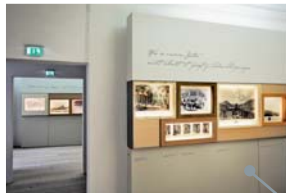
モーツァルトの音楽 的世界: フィガロの 部屋からドン・ジョヴ ァンニの部屋を臨む